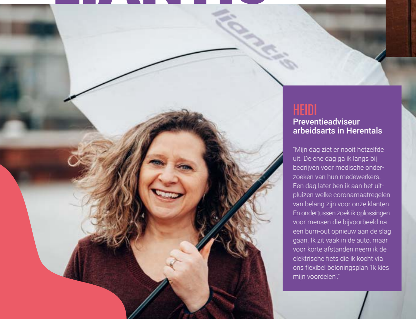
HEIDI Preventieadviseur arbeidsarts in Herentals

"Mijn werkdag start tussen acht uur en half negen, met het beantwoorden van mails van onze klanten, met vragen over ziekte, opleidingsverlof, loonberekening of sociale wetgeving. Ik deel een klantenportefeuille met twee andere collega's: samen volgen wij grotere bedrijven op. Onze klanten zijn heel divers: van poetsbedrijven tot horecazaken en brouwerijen. We berekenen de lonen, doen de uitbetalingen en houden nauw contact met de klant. Het is een heel boeiende en gevarieerde job. Maar het allerleukste is: ik ben beland in een topteam."